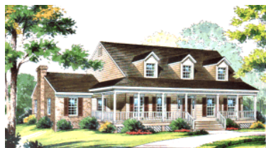
Perfekte amerik. orig. Cape-Cod-Front

Dementsprechend lieblos sehen die meisten amerikanischen Rückseiten aus. Und es macht wenig Sinn sie abzubilden. TWH beansprucht für sich, dass bei TWH ALLE 4 Seiten liebevoll designt werden, dass die Rückseite ästhetisch nicht hinter die Frontseite zurückfällt.