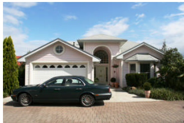
Von TWH nach US original Entwurf erbaut

In Amerika, in Canada, hat es Firmen die nur Häuser entwerfen. Firmen, die vom Verkauf dieser Hausentwürfe via Planbücher in Baumärkten und im Internet leben. D.h. der Bauherr oder eine Baufirma erwerben gegen durchschnittlich 1.000 $ Dollar das Recht ein Haus nach diesen Plänen zu bauen. Da diese Firmen vom Verkauf der Pläne leben, legen sie niemals alle Ansichten, Daten offen.