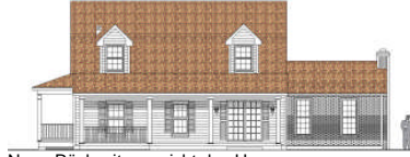
Neue Rückseitenansicht des Hauses von TWH an Front angepasst