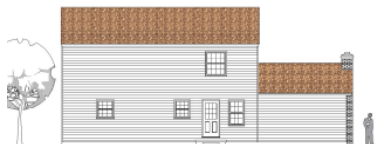
Total unzumutbarer US-Rückseitenentwurf Hauses